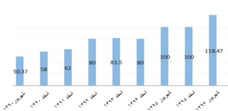
نمودار (۲): روند تغییر حجم مطالبات غیرجاری بانک‌ها، ۱۳۹۰-۱۳۹۶ (هزار میلیارد تومان)