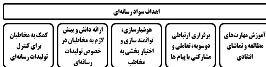
نمودار ۳. انواع سواد رسانه‌ای

داشتن نگاهی دقیق، عمیق و تفکری منتقدانه در جهت انتخاب صحیح گزینه‌های رسانه‌ای است (رهبر، ۱۳۸۱، ص. ۳۶. نقل از عرب‌انصاری، ۱۳۹۲، ص. ۹۵).